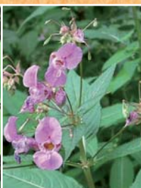
Balsamine de l'Himalaya