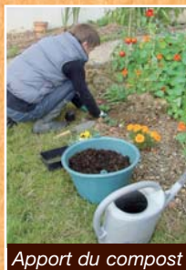
Apport du compost

Le compost complète le paillis pour accroître la fertilité du sol et nourrir les plantes exigeantes : légumes gourmands (tomate, chou, courgette, poireau, pomme de terre...), fruits et pelouse âgée.