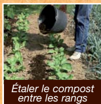
Étaler le compost entre les rangs