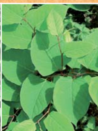
Renouée du Japon