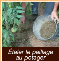
Étaler le paillage au potager

Recouvrez le compost d'une couche de paillis (tontes sèches, feuilles mortes, broyat frais...) pour plus d'efficacité.