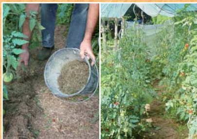
Étaler le paillage au potager