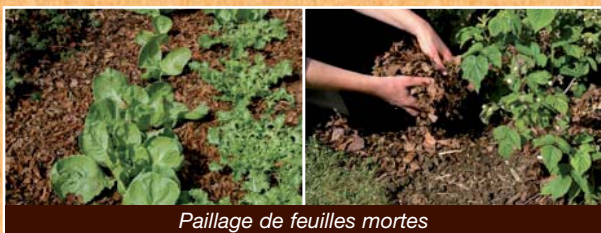
Paillage de feuilles mortes

En fin d'hiver : les vivaces, y compris les bulbeuses, les massifs après leur nettoyage.