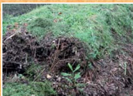
Compost en tas

Adapté aux grands terrains (plus de 1 000 m 2 ) disposant d'un important volume de déchets. Il est plus vulnérable aux animaux errants, au dessèchement ou aux excès d'eau. Couvrez-le avec un paillis pour maintenir un bon niveau d'humidité.