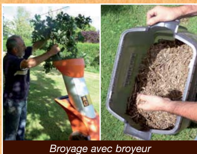
Broyage avec broyeur