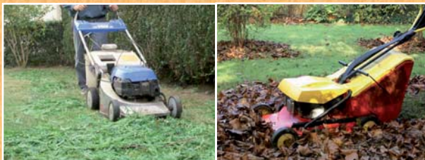
Broyage à la tondeuse