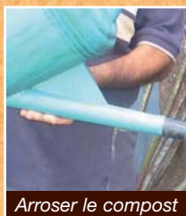
Arroser le compost