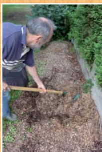
Stock de broyat

Les déchets de taille seront plutôt valorisés en paillage.