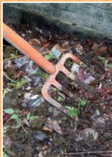
Aérer le compost

Mélangez les déchets humides et mous (déchets de cuisine, tonte) avec la fourche à d'autres plus grossiers pour assurer l'aération du compost. Remuez, décompactez et mélangez systématiquement les déchets entre eux lors de chaque apport.