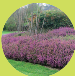
Sur des talus ou dans des massifs

Les PLANTES TAPISSANTES couvrent le sol rapidement et empêchent les herbes de pousser.