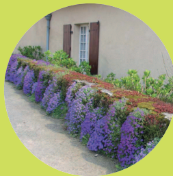
Au pied des murs