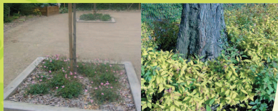
Au pied des arbres

« Ces plantes sont autant d'abris et garde-manger pour les insectes utiles. »