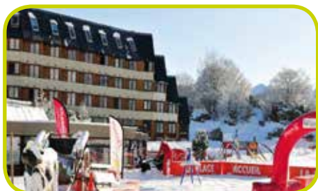
Val Louron, Pyrénées

Les enfants des classes de CP et CE1, soit 60 enfants, partiront au mois d'avril 2014, en classe transplantée à Erquy. Découverte du milieu marin (faune, flore) et activités nautiques seront au programme.