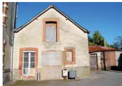
2- Photo prise en septembre 2012