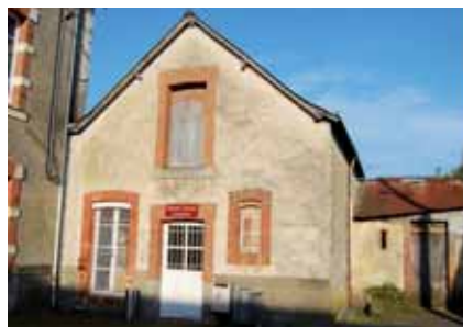
1- Photo prise en avril 2012

Quand les jeunes adolescents de Louverné pourront-ils bénéficier d'un local plus attractif , avec un animateur ?