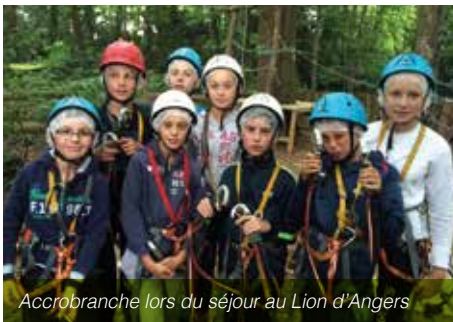
Accrobranche lors du séjour au Lion d'Angers