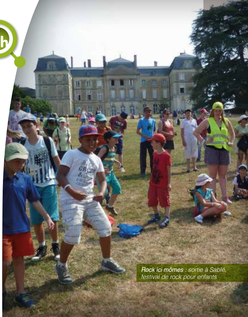
Rock ici mômes : sortie à Sablé, festival de rock pour enfants

109 enfants ont participé à la grande sortie du mois le vendredi 31 juillet à Papéa au Mans et 62 enfants sont allés visiter l'aquarium de Saint-Malo le mercredi 26 août.