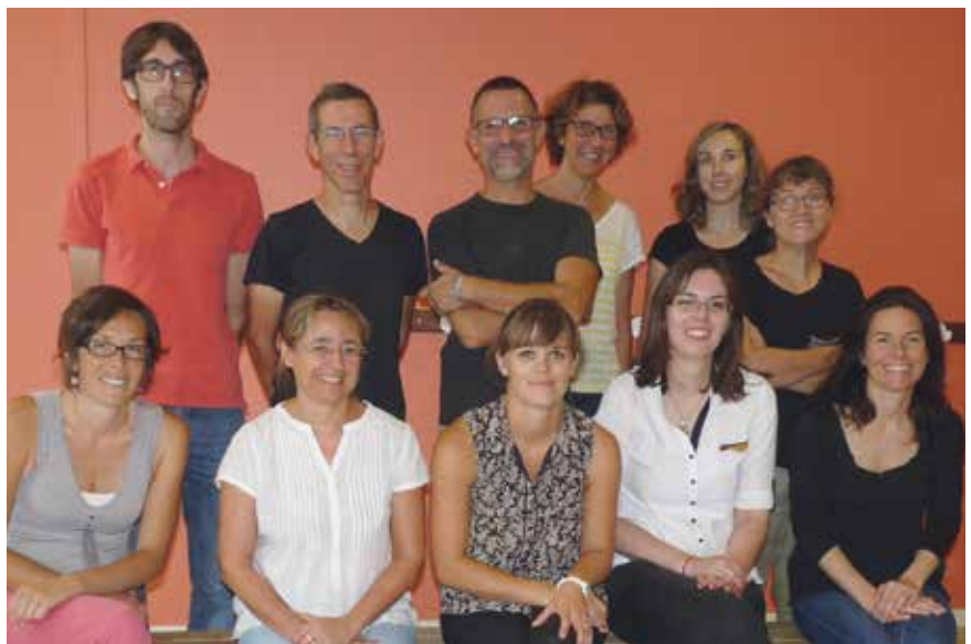
de gauche à droite et de bas en haut :

Une classe de mer aura lieu en Mai pour les 47 CE2, un travail avec Mayenne Nature Environnement se poursuit avec une découverte du halage pour les classes de cycle 2 et de nombreuses autres sorties sont programmées tout au long de l'année.