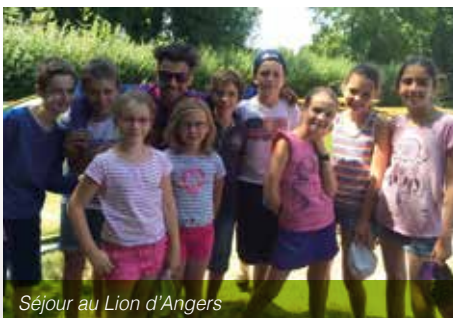
Séjour au Lion d'Angers