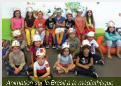
Animation sur le Brésil à la médiathèque