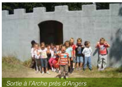
Sortie à l'Arche près d'Angers

enfants pour la sortie à Sillé-le-Guillaume